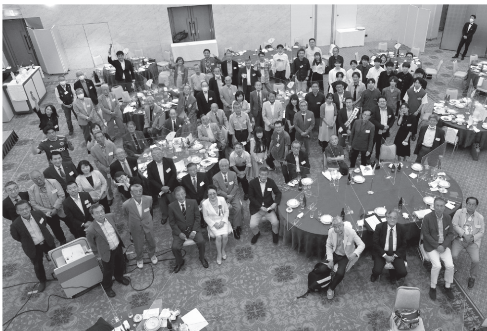
総会・懇親会全員集合

京同窓会のホームページをご覧ください。 百周年の記念事業の一つとして縣陵アカデミー館(仮称)の新築があります。既に大勢の方に御寄附をいただいておりますが、まだ目標の金額に達しておりません。縣陵アカデミー館(仮称)は縣陵生の集いの場所として在校生が勉強したり、地域の方達と学び合ったり、先輩達が講演をしたりと色々な用途で使えるよう計画しています。どうぞご協力の程、よろしくお願い致します。