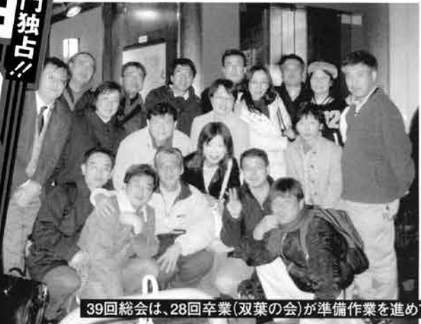
39回総会は、28回卒業(双葉の会)が準備作業を進めています。